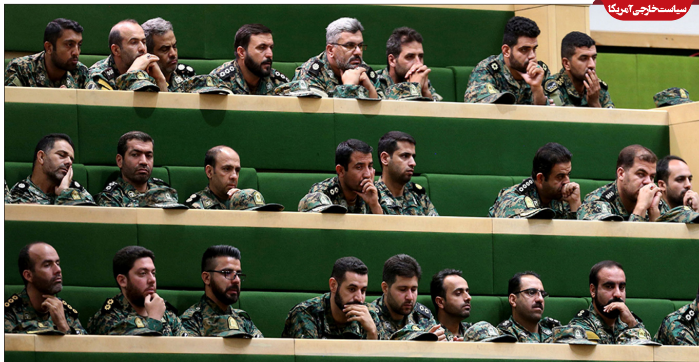
سیاست خارجی آمریکا

این نشریه از طریق ترجمه محتوای تحلیلی به بررسی مسائل زیر می‌پردازد: ۱- سیاست‌های آمریکا در غرب آسیا ۲- مسائل داخلی رژیم صهیونیستی و گاه‌ما مسائل داخلی آمریکا ۳- محور مقاومت، حوزه خلیج فارس، اروپا، قفقاز و آسیای میانه ۴- موضوعات مربوط به سیاست داخلی و خارجی ایران، برجام، اعتراضات مردمی و رهبری ۵- توییت‌های منتشر شده از سوی فعالان و مقام‌های سیاسی جهان.